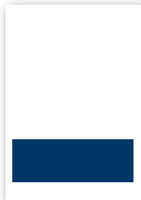
Format 4 185 x 65 mm 900 €